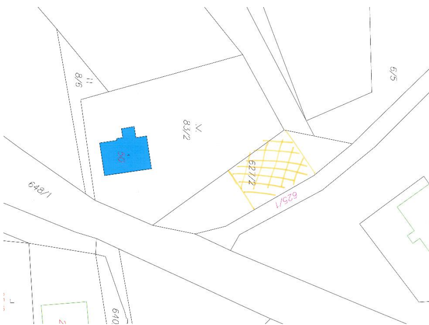
Obrázek 1p.p.č 627/2 k.ú.Černava