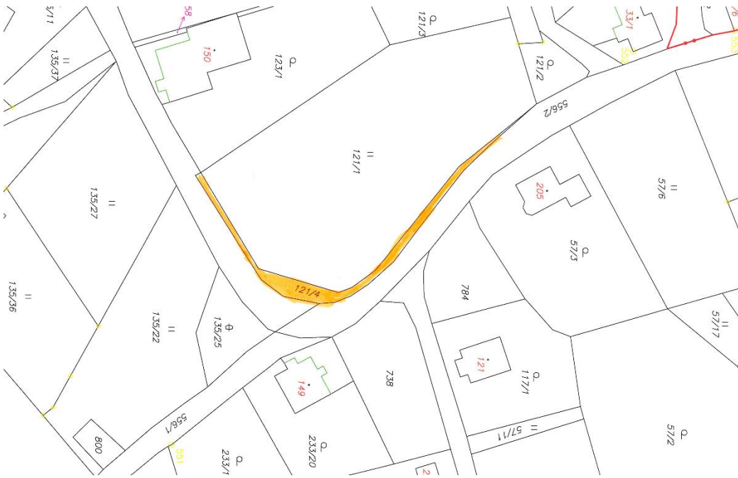
Obrázek 3 p.p.č.121/4 k.ú.Rájec u Černavy